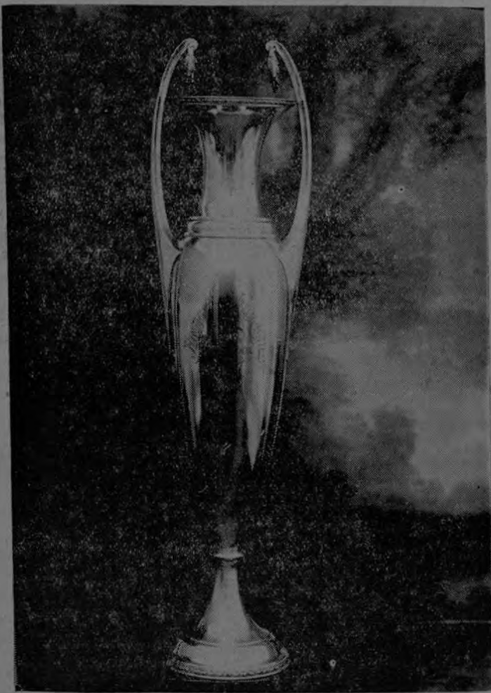
Trofeo Almacén Madrigal, conquistado por la Primera División del Club Sport "LA Libertad"